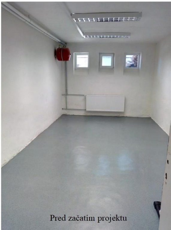
Pred začatím projektu

Nadácia ČSOB nám v rámci projektu „Aj autisti chcú športovať“ poskytla finančné prostriedky na zriadenie posilňovne, kde budú môcť mladí autisti v bezpečnom a vizualizovanom prostredí cvičiť, efektívne tráviť voľný čas a kde budú minimalizované vonkajšie vplyvy vedúce k nežiaducemu správaniu. Projekt bude ukončený do 15.8.2019.